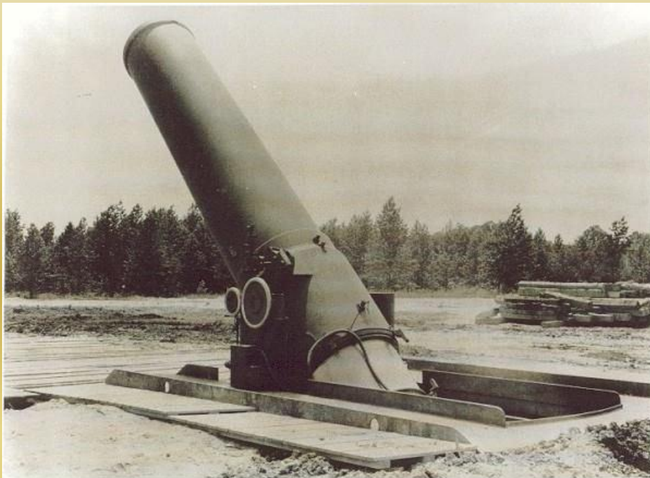
U.S. "LITTLE DAVID" 914MM(36 INCH) MORTAR BIGGEST MORTAR IN THE WORLD, CIRCA 1944